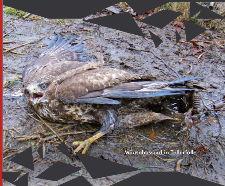
Mäusebussard in Tellerfalle